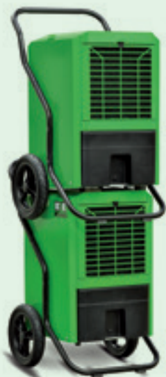
Vysoušeče REMKO lze stohovat