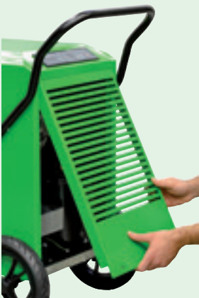
Konstrukce s příjemnou údržbou