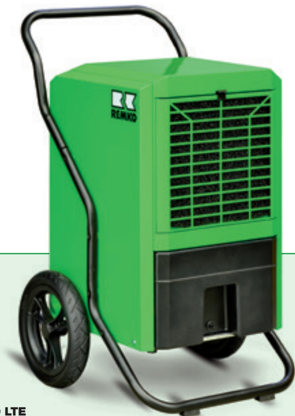
REMKO LTE 60

Vysoušení a odvlhčení spolehlivěji než to dělá slunce a vítr