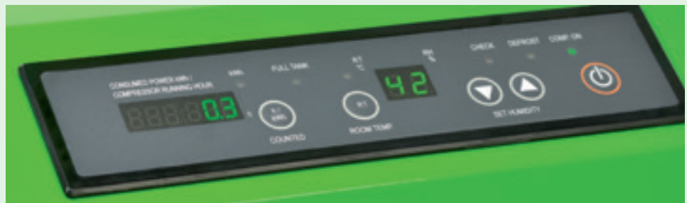
Přehledný ovládací panel